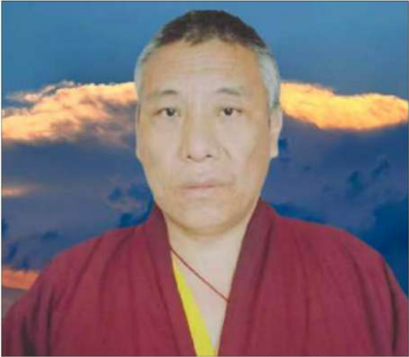
སྐུལ་སྐུ་དབལ་ལྷན་དབང་རྒྱལ། བར་གྱི་འབྲུང་ཁྲུང་ས། རོང་གནས་རྩ་ཞིབ།