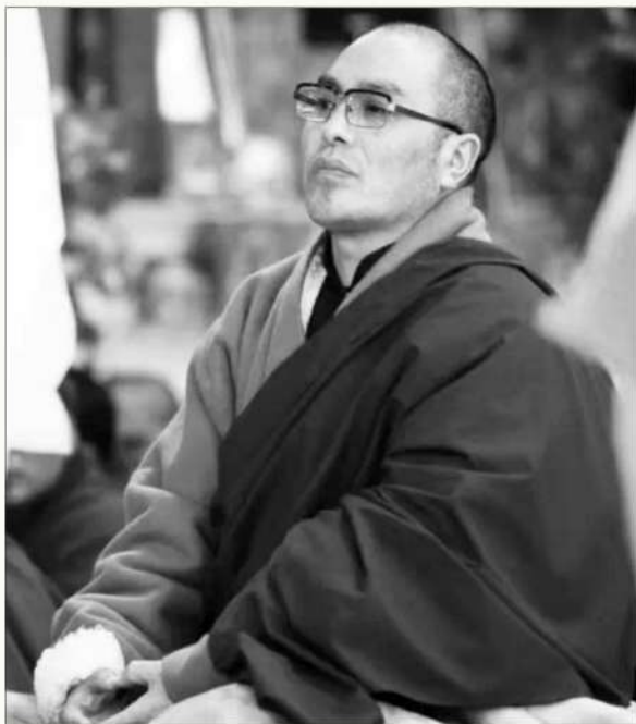
སྐབས་སྐྱོད་ཏུ་དཀར་དོན་ཆེ། བར་ལྷི་འབྲུང་ཁུངས། ཁོང་གནས་ལྷ་ཞིབ།