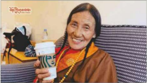
ལྷན་ཁྲིམས་ཀྱི་དཀར་ཤོད་རྒྱུ་ལྷན་གཏུགས་དཀར་ཤོད་ལྷོ་མ་ལ། ལོད་གནས་ལྷ་ཞིབ།

ཕྱི་ལོ་ ༢༠༢༥ ལྷ་ ༩ བར་མཉམ་འབྲེལ་རྒྱལ་ཚོགས་ཀྱི་འཕྲོ་བ་མིའི་ཐོབ་ བར་གི་ཆེད་ལས་མཁས་པ་བཞི་ཡིས་རྒྱ་གཞི་གཏུག་དང་ཚུལ་ཉེ་ནས་གཞུང་ ལ་ཕྱོད་དོན་འདྲིའི་ཐད་རྒྱལ་སྤྱིའི་ཞིམས་ལུགས་ཀྱི་གཏན་འབེབས་དང་། ཚོ་སྡོག་སྤྱད་སྤྱོད་དང་བཀག་ཉར་དོག་ནས་འདས་ཕྱོདས་སོང་བའི་ཕྱོད་དོན་ ལ་ཞིབ་འཇུག་ལྟར་དཔོན་པའི་དཔོན་པའུན་བཞོན་ཡོད་པ་མ་ཟད། རྒྱལ་སྤྱིའི་ ཚད་གཞི་སྟེ། <<དུས་མིན་འཆི་རླུན་སྐོར་གྱི་མི་ཁི་སོ་གའི་གཏན་འབེབས་ >> ལྟར། མཚོགས་ནས་སྤྱད་དུ་རང་དབང་དང་ཚང་བདེན་གྱི་ཐོག་ནས་ཞིབ་ འཇུག་ལྟར་དཔོན་པའི་ནན་བརྗོད་བྱས་ཡོད། ད་དུང་བཀག་ཉར་དང་གནས་ རྒྱུ་གི་རླུན་བཅས་དང་དཔོན་པ་དང་སྤྱི་ཚོགས་ལ་གཞོན་སྐྱོན་རྗེ་བྱུང་བཅས་ ཞིབ་མའི་གནས་ཚུལ་ལ་ལོ་སྐོར་དཔོན་སྐོར་ནན་བརྗོད་བྱས་ཡོད།