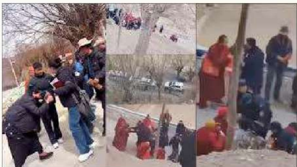
སྡེ་དགེ་རྫོང་གིས་རྒྱ་ནག་གཞུང་གི་གནས་སྡོད་པས་གཞི་མཚམས་འཛོག་དགོས་པའི་ལུ་འབོད་བྱེད་བཞིན་པ། སར་ཀྱི་འབྲུང་ཁྲུངས། བོད་ཀྱི་འགྲོ་བ་མིའི་ཚོལ་ཐང་དང་མང་གཙོ་འབེལ་རྒྱས་སྡེ་གནས་ཁང་།

མ་མཐར་ཡང་དགོན་པ་རྒྱག་སྟེ། ཡེ་ན་དགོན་དང་། དཔོན་སྡོད་དགོན། མཁའ་ མདོ་དགོན། རབ་བསྐྱེན་དགོན། དགོན་སར་དགོན། བགྲིས་དགོན་བཅས་རྒྱ་ ལོག་གི་ཉེན་ཁའི་ལོག་གནས་ཡོད། དེ་བཞིན་འགྲི་རྩའི་སྡོད་རྒྱུད་དུ་ཡོད་པའི་སྡེ་ དགེ་དང་འཛོ་མདའ་རྫོང་ཁོངས་ཀྱི་དཔོན་སྡོད་གོང་ཚོ་དང་ཞེ་པ་གོང་ཚོ་གཉིས་ གྲང་རྒྱ་ལོག་གི་ཉེན་ཁའི་ལོག་གནས་ཡོད། ས་གནས་བོད་མིས་པམས་གཞི་དེར་ སེམས་ཁྲུལ་ཆེན་པོ་བྱེད་ཀྱི་ཡོད་ཅིང་། དེས་སྐྱེ་ཁམས་ཁོར་ལུག་སྦྲར་གསེ་མི་ རྒྱབ་པའི་གཏོར་སྐྱོན་དང་ལུལ་མི་གནས་སྟོ། རིག་གཞུང་དང་འཚོ་བའི་གོམས་ སྟོལ། ཚོས་ལུགས་ཀྱི་ཉེན་གཞི་ཁག་པའང་གཏོར་སྐྱོན་ཐེབས་རྒྱའི་ཉེན་ཁ་ཡོད།