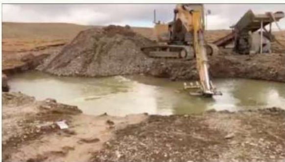
ཀ་བཞི་ཁྲམ་དུ་གཉེར་ཁ་སློབ་འདོན་བྱེད་བཞིན་པ། བར་ཀྱི་འབྲུང་ཁུངས། བོད་མིའི་བླ།

མི་མང་པོ་འབྱུ་བ་སྤྱད་བཀག་ཉར་བྱས་རྗེས་ཀྱི་ནག་གཞུང་གིས་ཀ་བཞི་སྐོང་རྣམ་ ཡོངས་ལ་བཀག་སློབ་བྱས་པ་དང་པན་ཚུན་འབྲེལ་མ་སྤྱད་ཀྱི་ལས་དོན་ཡོངས་ ཚོགས་མཚམས་འཛོག་བྱས་ཡོད་ཅིང་། བྱ་ཐབས་དེ་དག་ནི་འཐབ་ཕྱོགས་ གཅིག་ཕྱུར་ལས་ཁུངས་དང་། ཉེན་རྟོག་ལས་ཁུངས། དག་ཚམ་ཉེན་རྟོག་བཅས་ དང་དེ་བཞིན་སྐོང་ཚོའི་ལས་བྱེད་བཅས་མཉམ་འབྲེལ་བྱས་པ་ཞིག་རེད།