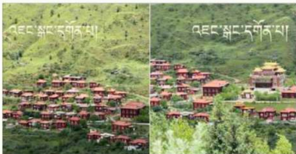
༡༥ དཀར་མཛེས་ལོད་རིགས་རང་སྐྱོང་ཁུལ་ཐག་མགོ་རྫོང་། ཡར་ཕྱི་འཇུག་ཁུངས། ལོད་མིའི་སྤྱི་གཞི་ འཇུགས་ཀྱི་རྒྱ།

ཕྱི་ལོ་ ༢༠༢༥ ལོར་དཀར་མཛེས་ལོད་རིགས་རང་སྐྱོང་ཁུལ་ཐག་མགོ་རྫོང་གི་ འཇར་སྐམ་དགོན་པའི་ཉེ་འཁྲིམ་སྤྱ་ཁྲིམས་འགལ་གྱིས་འཇུགས་སྐྱབ་བྱས་པར་ ཁ་གཡར་ནས་དེ་ཁུལ་གྱི་མཚོད་ཉེན་ ༣༠༠ ལྷག་ཙམ་གཏོར་བཤིག་བཏང་བ་ དང་། གནས་ཚུལ་ཕྱིར་གྲར་ལ་འཛིགས་ནས་ཁུལ་དེར་དམ་ཅན་གྲགས་ཆེ་བྱས་ པ་མ་ཟད། ལུལ་མི་ཚོར་ཡང་གནས་ཚུལ་ཕྱིར་གྲར་མི་ཚོགས་པའི་ཉེན་བརྟེན་ཡང་ བཏང་ཡོད།