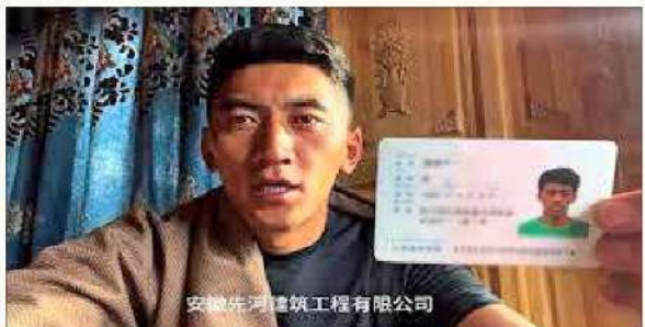
མཚོ་སྡོན་ཚེ་མིང་། པར་གྱི་འབྲུང་ལུངས། བོད་ཀྱི་དུས་བབ།

གནས་ཚུལ་ཚོན་པར་གཞིགས་ན། ཕྱི་ལོ་ ༢༠༢༥ ལྷ་ ༡༡ ཚེས་ ༥ ཉིན། གསེར་ ཁོག་ལུལ་དུ་གསེར་གཏེར་སྡོག་འདོན་གྱི་བཞེད་པ་དེ་གའི་ལུལ་མིས་ཤེས་ ཉོགས་བྱུང་བར་བརྟེན། ལས་གཞི་དེས་ཁོར་ལུག་ལ་གཏོར་སྡོག་གཏོར་བཞེད་ པའི་གནས་ལུགས་དག་གྲོང་ཚོའི་འགོ་ཁྲིད་ལ་སྡུག་གསེར་ལུས་ཡོད། ཡིན་ན་ འང་། ས་གནས་ཀྱི་འགོ་ཁྲིད་ཚོས་ལས་གཞི་དེར་བརྟེན་དཔུང་ཞིབ་འདུག་མ་ བྱས་པར་སྣང་མེད་བཏང་བ་མ་ཟད། གཏེར་ཁ་སྡོག་གི་ལས་གཞི་སྡུ་མཐུད་ བས་འགོ་དུ་བརྟེན་པ་དང་། མི་དམངས་ཀྱི་སྡུག་གསེར་ཡང་ཕྱིར་སྡོག་བྱས་ ཡོད། ས་ཆའི་བདག་དབང་ཡོད་ཚད་རྒྱལ་ཁབ་ལ་དབང་ཡོད་ལུགས་བཤད་ཉེ་ བོད་མི་རྣམས་རང་གི་པ་མེས་ཀྱི་ས་ཆའི་ཚོན་ལུངས་སྡོག་འདོན་གྱི་མཁན་ལ་ངོ་ རྒྱུ་གྱི་ས་འཕམ་ཡང་ན་གཏུག་བཤེར་གྱི་པའི་ཐོབ་ཐང་ཡོད་ཚད་མེད་པ་བཅོས་ ཡོད།