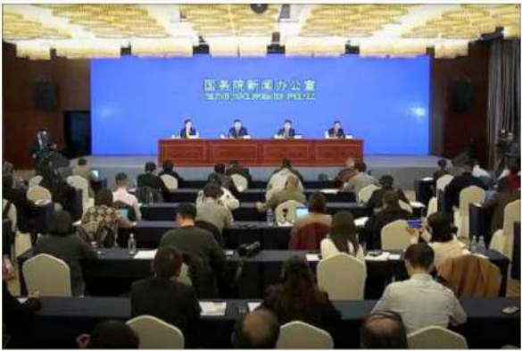
རྒྱལ་སྤྱི་ལྷི་རྒྱལ་ཁབ་ཟེར་བས་ལྷ་སར་ཏུ་ས་འབས་གསར་པའི་བོད་ཀྱི་འགོ་བ་མིའི་ཐོབ་ཐང་སྤོང་གི་རྒྱལ་གཞི་དགའ་ ཡོའི་དུལ་འགྲེས་སློབ་བྱས་པ། བར་གྱི་འབྲུང་ཁུངས། SCIO.GOV.CN

མཇུག་ལྟར་ན། རྒྱ་གོང་དང་སྤྱོད་སྤོངས་ཟེར་བའི་འགོ་ཁྲིད་ཀྱི་ཀྲམ་ཚོལ་རྟུན་ བས་པའོད་དོན། བོད་སྤོངས་ཀྱིས་ཞིང་ཚེན་གཞན་དག་དང་འབྲ་བར་གཅིག་ ལྷན་གྱི་རྒྱལ་ལས་གཞིའི་སློབ་ཚན་རྒྱ་ཡིག་དང་། ཨང་ཅིས། དཔྱིན་ཟི། ལུ་ཏུ་ ལྷ། འཇར་པན། ལྷང་རན་མི། འཇར་མི་ལི། སོ་པཎ་ཡ་པཅས་ཀྱི་རྒྱལ་གྱི་ ལྷན་ཡིག་རྒྱལ་ལས་གཞི་གཅིག་ལྷན་ལུ་རྒྱ་ཡིན་པ་དང་། དེས་བོད་རིགས་སློབ་ ལུག་ཚོར་རྒྱས་ཚད་མཐོ་བའི་སློབ་གསོའི་གོ་སྐབས་ཐོབ་རྒྱ་མང་ཏུ་འཕྲོ་རྒྱ་ དང་། ཁོ་ཚོའི་རྩལ་ལོངས་ཀྱི་ཚན་རིག་རིག་གནས་ཀྱི་རྒྱ་ཚད་གོང་མཐོར་ འཕྲོ་རྒྱར་པན་ཐོག་ཡོད་པའི་ནན་པོའི་བྱས་ཡོད། ཡིན་ནའང་། རྒྱལ་ཡོངས་ གཅིག་ལྷན་གྱི་ཡིག་རྒྱལ་ལས་ནང་བོད་ཡིག་གི་གནས་བབ་དམའ་ཏུ་བཏར་བ་དེས་ རྒྱ་ཡིག་ནི་སློབ་གསོ་སྤོང་བའི་སྤྱི་སྐད་ཡིན་པའི་གནས་བབ་སྔ་བརྟན་ཏུ་བཏར་ ཡོད།