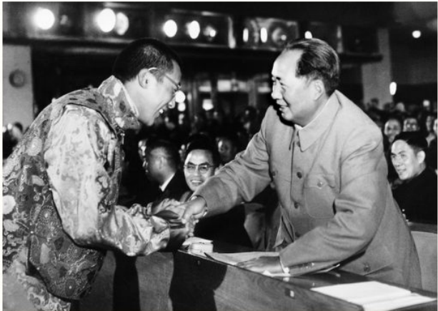
ཕྱི་ལོ་ ༡༩༥༧ ལོར་ ཤ་གོང་ས་མཚོག་རྒྱ་ནག་ལ་ལེགས་རྒྱུ་ལོངས་མི་དམངས་འབྲུས་མི་ཚོགས་ཚན་རྒྱུ་བས་

ནས་དུས་རྒྱུ་བས་གཅིག་གི་རིང་ལུ་བཅུན་མིག་གིས་མཐོང་རྒྱུ་མེད་པ་བཟོས། དེ་ནི་དུས་རབས་བརྒྱད་པའི་ནང་གྲང་དང་མས་སངས་རྒྱས་ཀྱི་བརྟན་པ་ཅ་མེད་ བཟོས་ཏེ་རྒྱུ་བས་གཅིག་གི་རིང་ལུ་བཅུན་མིག་གིས་མཐོང་རྒྱུ་མེད་པ་བཟོས་རྗེས་ གྱི་ཚོགས་མ་དེ་རེད།