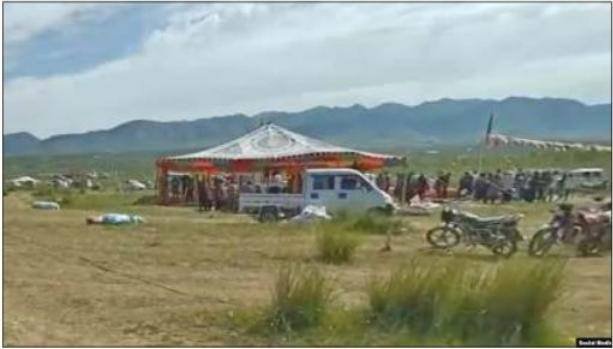
མོད་པའི་དུས་རྒྱུན་སོགས་ཀྱི་སྐབས་དམ་ཅག་གྲེང་བཞིན་པ།

ཕྱི་ལོ་ ༢༠༡༣ ཟླ་ ༡ ཚེས་ ༡༦ ཉིན་ཨེ་ཤེ་ཡ་རང་དབང་རྒྱུང་འཕྲིན་ཁང་ བས་ལྟེ་མ་པའི་གསར་འགྱུར་ཞིག་གི་ནང་གཞིས་ལུགས་མོད་མི་ཞིག་གིས་ས་ གནས་ས་ཐོག་ནས་གནས་རྒྱུ་ལོ་རྒྱུན་གནང་བ་ཞིག་ལུང་འབྲེན་གྱས་པའི་ བར། 50 མོད་ཀྱི་རྒྱལ་ས་སྐྱ་ས་སོགས་ཀྱི་ལུང་དུ་རྒྱ་ནག་གཞུང་གིས་མོད་མིའི་ འཕྲོ་འདུག་ཐང་དམ་ཅག་གྲེང་བཞིན་ཡོད་པ་དང་། ལོ་གསར་རིང་མོད་མི་ཚོར་ འགོག་ཐོན་གྱི་འདུ་ཤེས་ཐབ་ཏུ་བཏང་ནས་བདེ་འཇགས་ལ་འགན་ལེན་དགོས་ པ་རྒྱུ་ནས་བར་རྫོང་དང་ཁྲིམ་གཞུང་གང་སར་གསར་བའི་བརྟན་མིག་གསར་ འཇུགས་དང་། ལྷོ་ལེ་གཅིག་རེའི་སར་ཉེན་རྟོག་པའི་ས་ཚིགས་བརྩམས་ནས་ ལམ་འཁོར་བ་ཚོ་འཕོད་འགྲུག་དང་། ཁ་བར་སྲོག་བཤེར་། ལུས་བཤེར་གཏོང་ བ་སོགས་གྲེང་བཞིན་ཡོད། ཟླ་ ༡ བའི་བཟུང་གོང་གི་ནང་ཉེན་རྟོག་དང་ ཅག་ཆས་དམག་མི་འཕོར་ཆེན་འགྲེམས་འཛོག་གྱས་པ་ཡོད་པ་མ་ཟད་དུགས་ ཆས་སྤྱད་པའི་གསར་བའི་མི་སྣ་ཡང་འཕོར་ཆེན་འགྲེམས་འཛོག་གྱས་ཡོད་