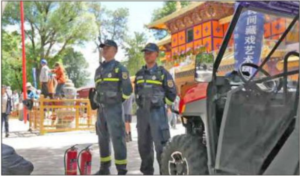
ལྷ་སའི་ཞོ་སྤོན་གྱི་ལྷ་མོ་འཁྲབ་སྟོན་སྐབས་ཉེན་རྟོག་པས་ལྷ་སྤུང་ནན་པོ་བྱེད་བཞིན་པ།

ཕྱི་ལོ་ ༢༠༡༣ ལྷ་ ༥ ཚེས་ ༡༩ ཉིན་ཨ་འཛིན་རྒྱུ་འཕྲིན་ཁང་གིས་སྲེལ་བའི་ གནས་ཚུལ་ཞིག་གི་ནང་། 53 ལོ་དེའི་ལྷ་ ༥ ཚེས་ ༡༩ ཉིན་མཚོ་སྤོན་ཞིང་ཆེན་ མཚོ་སྤོ་ཁུལ་མང་ར་རྫོང་མགོ་མང་གྲོང་ཚོ་ས་སྤྱད་གཞི་སྤེ་བར། སྤྱབས་རྗེ་ ཨ་ཐེས་སྐལ་བཟང་བགྱིས་རྒྱ་མཚོ་མཚོག་ནས་དུས་འཁོར་དབང་ཆེན་གནང་ བར། ས་གནས་རྒྱ་ནག་གཞུང་གིས་བྲག་ཆས་ཉེན་རྟོག་དམག་མི་བཏང་ནས་ དུས་དབང་བཀག་སྡོམ་བྱས་པ་དང་། དེ་ཡང་དུས་དབང་སྣ་བོན་དབྱ་འཇུགས་ མ་གནང་གོང་ཅམ་ལ་ཉེན་རྟོག་དམག་མི་ཡོང་ནས་དུས་དབང་གོ་སླིག་ཞུ་མཁན་ གྱི་འབྲེལ་ཡོད་མི་སྣ་འཇུ་བརྒྱུད་བྱས་པ་དང་། བ་ལམ་ནང་བརྟན་པར་འབྲེལས་ སྲེལ་བྱེད་མཁན་སྐོར་འབྲུག་ཇི་ཅད་བྱས་པ། ལྷ་ག་པར་དུ་དུས་དབང་གི་དཀྱིལ་ འཁོར་ཐོག་ཚུ་བཞེས་ནས་གཏོར་བཞིག་བཏང་ཡོད་ཅིང་། ཉེན་རྟོག་པས་ང་ཚོ་ གོང་རིམ་གྱི་བཀའ་སླུབ་གྱི་ཡོད་པ་ལས་གཞན་གྱི་རྒྱ་མཚོན་གང་ཡང་མེད་ཅེས་