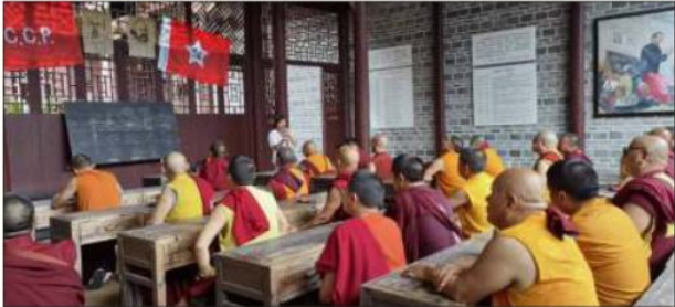
བྱ་བལྟའི་རྣམས་མ་རྒྱན་ག་དམར་ཤོག་ཚོགས་པའི་ལོ་རྒྱུས་རོ་སློབ་ཁྱེད་བཞིན་པ།

དབང་གནས་ཐུབ་པའི་རྒྱ་མཚན་>>ཟེར་བ་དང་། <<ཅིང་ཀང་རི་པོའི་འཐབ་ ཚོད་>>ཅེས་པའི་རྒྱ་གསལ་ཡོད་པའི་ཆབ་སྲིད་དང་འབྲེལ་བའི་ཚོམ་ཡིག་ ཁག་གཉིས་ཡང་སྐབས་དེར་ཚོམ་འབྲི་བྱས་པ་ཞིག་རེད། 44 ལུང་ཅང་སློབ་ གྲིང་ནི་མན་རུའི་དུས་སྐབས་སྡེ་ཕྱི་ལོ་ ༡༩༤༠ ལས་རྒྱག་བྱས་པ་དང་། ཕྱི་ལོ་ ༡༩༥༡ ཟླ་ ༤ པའི་ཟླ་མཇུག་ཏུ་དམག་སྲི་ཡུལ་ཏེ་དང་ཁོན་དཔེས་འགོ་ གྲིང་བྱས་པའི་ནན་ཁང་གྲེན་ལངས་དམག་དབྱུང་སྐྱབ་མ་རྣམས་དང་། ཏུལ་ བན་གྲེན་ལངས་སྐབས་ཀྱི་དམག་དབྱུང་སྐྱབ་མ་རྣམས་ལུང་ཅང་གྲོང་ཁྲིའི་དུ་ འགྲོར། དེ་གར་མའོ་ཅེ་ཏུང་གིས་འགོ་གྲིང་པའི་སྡོན་བལྟའི་གྲེན་ལངས་དམག་ དབྱུང་དང་མཉམ་འཛོམས་བྱུང་ཡོད། དེ་ནི་རྒྱ་གསལ་ཚོ་པའི་ཅིང་ཀང་རི་པོའི་ ལྷན་འཛོམས་ཞེས་པ་དེ་རེད།