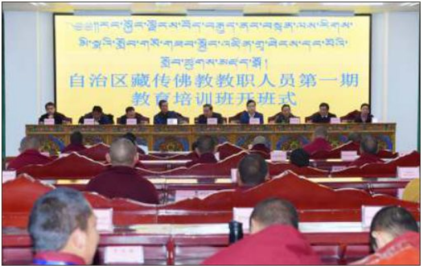
མོད་བརྒྱུད་ནང་བརྟན་གྱི་དགོན་སྡེའི་ལས་སྡེ་གསོ་སྐྱོང་གི་འཛིན་བྱ་གཉེད་པའི་མཇུག་རྫོང་།

བཅུན་བྱེད་པར་འབད་བཅོན་བྱེད་པའི་སློབ་གསོའི་ལས་འགུལ་གཉིད་ཐབ་སྤེལ་ དགོས་པའི་ནུབ་བཅོམ་བྱས་ཡོད། ན་ཏུང་<<མོད་བརྒྱུད་ནང་བརྟན་གྱི་ལས་ ལྗེ་གསོ་སྐྱོང་བྱེད་པའི་ ༢༠༡༤-༢༠༢༢ བར་གྱི་ལོ་ལཱའི་འཆར་གཞི་>>ཞེས་པ་ དངོས་སུ་ཞིབ་འཇུག་གཏན་འབེབས་བྱས་ཡོད་ཅིང་། གཅིག་གླུར་གྱི་སློབ་ཚན་ དང་སློབ་དེབ་བཀོད་སློབ་བྱས་ཏེ་སྤྱོད་ལོངས་ནས་ལམ་སྟེན་ལས་འགུལ་ཅན་དང་ཚད་ ལྡན་ཅན་དུ་སྐྱོང་བཅུན་སྤྱད་དེ་གྲ་བཅུན་རྣམས་ཚབ་སྲིད་ཐང་ལང་སྤྱོད་པ་བཅུན་ པ་དང་། བསམ་སློབ་ཐང་རིག་པ་དུངས་གསལ་དགོས་སུ་གསལ་གྱི་ཆ་རྒྱུན་བཏོན་ ཡོད།