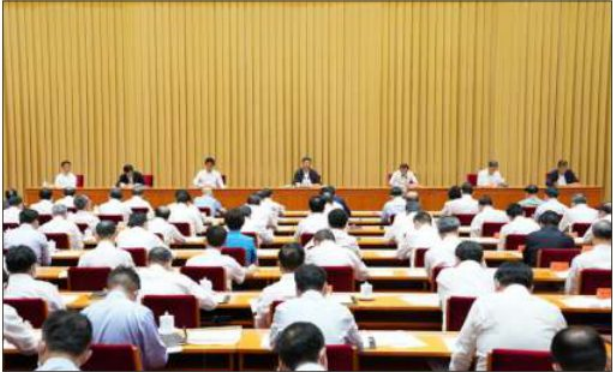
བོད་གྱི་ལས་དོན་སློང་གྱི་བརྒྱགས་རོལ་ཚོགས་འདུ་ཟེངས་བདུན་པའི་ཐོག་ཞི་ཅིང་མིང་གིས་གཏམ་བཤད་བྱེད་བཞིན་པ།

ཕྱི་ལོ་ ༢༠༡༧ ལོར་སློང་འཚོགས་ཁྲུས་པའི་དམར་ཤོག་ཚོགས་པའི་ རྒྱལ་ཡོངས་ཚོགས་ཆེན་བཅུ་དགུ་དང་། ཕྱི་ལོ་ ༢༠༡༩ ལོར་སློང་འཚོགས་ཁྲུས་ པའི་དམར་ཤོག་ཚོགས་པའི་རྒྱལ་ཡོངས་ཚོགས་ཆེན་ཉི་ཤུ་འཛོམས་ཚོས་ལུགས་ ལུང་གོ་ཅན་གྱི་སྲིད་རྒྱུས་ཟེར་བ་ནན་བརྗོད་ཁྲུས་ཡོད་པ་མ་ཟད། ལྷག་པར་དུ་ ཕྱི་ལོ་ ༢༠༢༠ ལོར་སློང་འཚོགས་ཁྲུས་པའི་བོད་གྱི་ལས་དོན་སློང་གྱི་བརྒྱགས་ རོལ་ཚོགས་འདུ་ཟེངས་བདུན་པའི་ཐོག་ཞི་ཅིང་མིང་གིས་བོད་རྒྱུད་ནང་བཞུག་ ལུང་གོ་ཅན་དུ་སྐྱེལ་འདེད་གཏོང་དགོས་པའི་ནན་བརྗོད་ཀྱང་ཁྲུས་ཡོད།