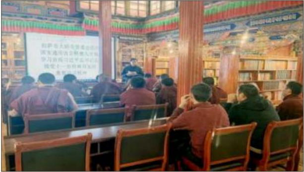
བྱ་བཅུན་ནམས་ལ་རྒྱ་ཡིག་སློབ་ཁྲིད་བྱེད་བཞིན་པ།

ལས་བྱེད་ ༣༡ གིས་སློབ་ཁྲིད་ཀྱི་འགན་འཁུར་བཞིན་ཡོད་པ་དང་། ཟླ་ ༣ པ་ ནས་སློབ་ཚན་ཐེངས་ ༡༠༠ ཙམ་སློབ་ཁྲིད་བྱས་ཡོད། བྱ་བཅུན་ཉུང་བའི་དགོན་ རྒྱུ་ནམས་གཅིག་བསྐྱེས་ཀྱི་སློབ་ཁྲིད་བྱེད་པ་དང་། ཐག་རིང་སར་གནས་པའི་ དགོན་སྡེར་དམིགས་བསལ་གྱི་ལས་བྱེད་མངགས་གཏོང་གིས་སློབ་ཁྲིད་བྱས་ ཡོད།