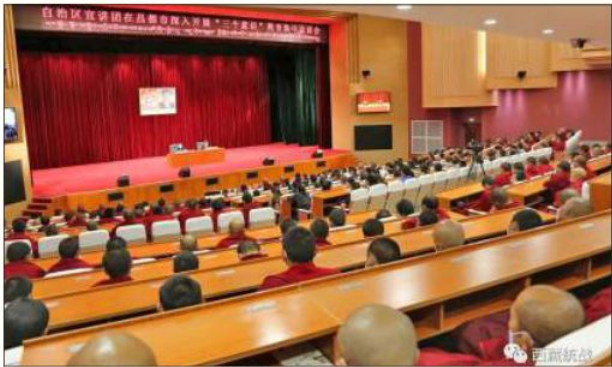
ཆབ་མདོ་ཁྲུལ་དུ་འདུ་ཤེས་གསུམ་ཟེར་བའི་བསམ་སློབ་སློབ་གསོ་གཏོང་བའི་ཚོགས་འདུ།

ཚོགས་འདུའི་ཐོག་ཀྲམ་ཆེ་བརྟན་གྱིས་རིས་མེད་གྲུ་བརྟན་ཚོས་རྒྱལ་ཁབ་ །གཅིག་གྱུར་གྱི་སྐད་ཡིག་སློབ་སྦྱོང་བྱེད་དགོས་པའི་གལ་ཆེའི་རང་བཞིན་དང་། དེ་བཞིན་རྒྱལ་ཁབ་གྱི་འདུ་ཤེས་དང་། ལྷི་དམངས་གྱི་འདུ་ཤེས། ཁྲིམས་སྦྱོང་ །གྱི་འདུ་ཤེས་དགོས་ལུགས་དང་། ཞི་ཅིང་ཕིང་གིས་གསལ་སྟོན་བྱས་པའི་འདུ་ །ཤེས་གསུམ་གྱི་རིལ་བརྒྱགས་དང་སློབ་གསོ་སླེབ་དགོས་པའི་གལ་གནད་དང་ དམིགས་ལུལ་འགྲེལ་བརྗོད་བྱས་ཏེ་རིས་མེད་གྲུ་བརྟན་ཚོས་ཆབ་མདོ་གྱི་ལང་ །སྤྲོགས་དང་གོ་རྟོགས་སྤར་བས་མཐོང་འདེགས་དགོས་པའི་ནན་བཤམ་བྱས་ །ཡོད།