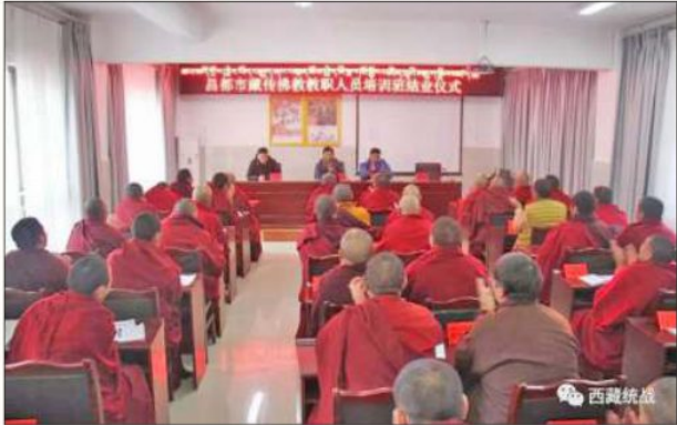
ཆབ་མདོ་ཁྲུལ་གྱ་བོད་བརྒྱུད་ནང་བསྟན་གྱི་ལས་སྡེར་གཤམ་སྐྱོད་གི་འཛིན་གྲ་གཉེར་བའི་ཚོགས་འདུ།

དང་། <<བོད་བརྒྱུད་ནང་བསྟན་གྱི་ཚོས་ལུགས་མི་སྣ་གཤམ་སྐྱོད་ལ་ལུགས་སྟོན་རྒྱག་རྒྱུའི་ལས་ཀའི་བསམ་འཆར།>> དེ་བཞིན་ <<མི་ལོ་ ༢༠༡༤-༢༠༢༢ བར་གྱི་ཆབ་མདོ་སྲོང་ཁྲིམ་བོད་བརྒྱུད་ནང་བསྟན་གྱི་ལས་སྡེར་སྐྱོད་བརྒྱུད་>>དོན་འཁྲོལ་གྱ་ཚད་མེད་ཅེས་འཁོད་ཡོད།