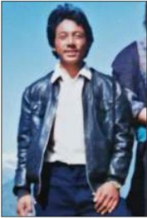
དགོན་མཚོག་སྤྱིན་པ།

གི་འབྲུང་ཅ་མེད་པ་བཟོ་དགོས་པའི་དེའི་བསྐྱབས་ལུགས་ཆེ་བྱེད་བཞིན་ཡོད་ པ་མ་ཟད། དེ་འབྲེལ་གྱི་སྲིད་རྒྱུས་ཀྱང་རབ་དང་རིམ་པ་ཞིག་གཏན་འབེབས་ གུས་ཡོད་ཀྱང་། རོན་དངོས་ཐོག་སྲིད་རྒྱུས་དང་བྱ་ཐབས་དེ་དག་ནི་བཟན་སྡེ་ སྲུང་སློབ་བྱ་རྒྱ་ལས་ལྗོག་ཏེ་བཟན་སྡེ་མེད་པ་བཟོ་བའི་རྒྱ་རྒྱུན་རོ་མ་ཆགས་ ཡོད། དཔེར་ན། དགོན་སྡེ་ཁག་ལ་འཛོམས་དགོས་པ་དགུ་ཞེས་པ་གཏན་ འབེབས་གུས་ཏེ་དགོན་པའི་ཡང་ཐོག་ཏུ་རྒྱ་མིའི་རྒྱལ་དང་འཇུགས་དགོས་པ་ དང་ལྷ་ཁང་དང་གྲུ་ཤག་ནང་རྒྱ་མིའི་འགོ་ཁྲིད་གྱི་འཇུག་པར་སྤྲིག་གསོམས་བྱེད་དུ་ བཅུག་ནས་ལྷ་སྐྱེ་རྟེན་གསུམ་དང་གཞས་བབ་གཅིག་གི་ཐོག་ཏུ་འཛོག་དགོས་ པའི་གཏན་འབེབས་གུས་ཡོད། རྒྱ་གཞུང་གི་འགོ་ཁྲིད་ནི་ཚོས་ལ་དད་པ་མེད་ པ་མ་ཟད། ཚོས་དུག་ལ་རོས་འཛིན་བྱེད་མཁན་གྱི་དམར་པོའི་རིང་ལུགས་པ་ ཞིག་ཡིན་པས། ཚོས་དུག་ལ་རོས་འཛིན་བྱེད་མཁན་གྱི་མི་ཞིག་གི་འཇུག་པར་ དང་། དགོན་པའི་ལྷ་སྐྱེ་རྟེན་གསུམ་མཉམ་དུ་སྤྲིག་གསོམས་བྱེད་དུ་འཇུག་པ་ བེ་རོན་དངོས་ཐོག་གྲུ་བཅུན་ཚོའི་སེམས་ལ་བཟོད་ཐབས་མེད་པའི་ཕོག་ཐུག་ བཏང་བ་ཞིག་རེད། དེར་བརྟེན། སུས་འཇུག་པར་དང་རྒྱལ་དང་ལམ་ན་འཇུ་ བཅུང་བཟོན་འཇུག་བྱ་རྒྱུར་ཐེ་ཚོམ་མེད།