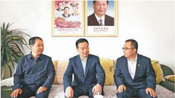
བོད་རང་སྐྱོད་རྫོང་ས་ཁེར་བའི་དམར་ཤོག་བྱང་ཆེ་མང་ཚུན་གྲེང་གིས་ཤོན་སྐྱེས་གསོའི་སྐོར་བྲུག་འབྲང།

ཕྱི་ལོ་ ༢༠༡༥ ཟླ་ ༩ ཚེས་ ༡ ཉིན་བོད་རང་སྐྱོད་རྫོང་ས་ཁེར་བའི་དམར་ཤོག་བྱང་ ཆེ་མང་ཚུན་གྲེང་གིས་དགེ་ཆུན་གྱི་དུས་ཆེན་དང་རྟུག་ས་བསྐྱུན་ནས་སྐེལ་བའི་ གཏམ་བཤད་ནང་། 17 གཞོན་སྐྱེས་སློབ་ཡུལ་ཚོར་བསམ་སློབ་ཆབ་སྲིད་ཀྱི་སློབ་ གསོ་གཏོང་རྒྱུར་འབྲུག་སྐོན་བརྒྱུ་ནས་ཉར་གུ་ལོ་རྒྱུས་དང་། ཡུང་གོ་གསར་འཛི་ ལོ་རྒྱུས། བསྐྱར་བཅོས་སྐོར་དབྱེ་ལོ་རྒྱུས། སྤྱི་ཚོགས་རིང་འཇུག་ས་འབེལ་རྒྱས་ ཀྱི་ལོ་རྒྱུས། ཡུང་རྒྱུ་འཛི་གས་འབེལ་རྒྱས་ཀྱི་ལོ་རྒྱུས་བཅས་ཀྱི་ལ་བསྐྱུག་སློབ་ གསོའི་ལས་དོན་སྐེལ་དགོས། སློབ་ཡུལ་གིས་གོ་སྐྱབ་བ་དང་། མཚོང་འདོད་ལ་ ཉན་སྐོར་བའི་ཐབས་ཤེས་སྲུང་ནས་དུས་རབས་གསར་འཛི་བོད་ཀྱི་གཏམ་རྒྱུད་ བཤད་ནས་གཞོན་སྐྱེས་སློབ་ཡུལ་རྟུག་ས་འཛི་གས་ལ་བར་དུ་སྐོར་བརྒྱུ་འཇུག་མེད་དང་ ཉར་གུ་བཀའ་ལ་ཉན་བ་དང་། ཉར་གུ་འཛི་ཚོར་བ། ཉར་གུ་རྗེས་སུ་འབྲང་དགོས་ འཛི་ནན་བརྗོད་བྱས་ཡོད།