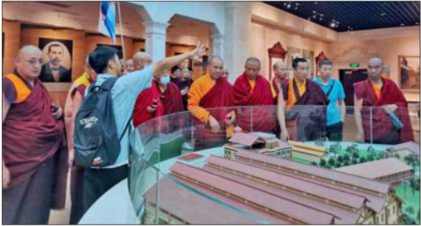
ཕྱ་བཅུན་རྣམས་གསར་བཞེད་རྟེན་གཞིའི་ཁུལ་ལ་སྐྱ་སྐོར་གྱེད་དུ་འཇུག་བཞིན་པ།

དེ་བཞིན་གྱི་ཁང་ཀྱང་ (zhengcheng gong 郑成功 1624-1662) གི་བྲན་གསོ་ཁང་དུའང་བལྟ་སྐོར་གྱེད་དུ་བཅུག་ཡོད། གྱི་ཁང་ཀྱང་ནི་རྒྱ་ བྱ་མིང་རྒྱལ་རབས་སྐབས་ཀྱི་དམག་དཔོན་ཆེན་པོ་ཞིག་ཡིན་ཞིང་། ཕྱི་ ལོ་ ༡༦༥༣ ལོར་འཇར་པན་དུ་སྐྱེས། རང་ལོ་ ༧ ལ་སླེབས་སྐབས་རྒྱ་བྱ་གལ་ ཕྱིར་ལོག་བྱས། རང་ལོ་ ༡༥ ལ་སྐབས་ཡིག་རྒྱུག་ལ་འགྲོད་ནས་རིམ་བཤམ་ཁྲུང་ ཙམ་གྱི་འགྲུང་ལུགས་སོགས་ལ་སློབ་སྦྱོང་བྱས། སྐབས་དེར་མིང་རྒྱལ་རབས་ ཉམས་རྒྱུ་འགོ་བཞེད་ཡོད་སྟེ། རང་གི་མ་ཡི་རྗེས་སུ་འབྲངས་ནས་དམག་ འཐབ་མང་པོའི་ནང་མཉམ་ཞུགས་ཀྱིས་བྱས་རྗེས་ཆེན་པོ་བཞག་པའི་དམག་ དཔོན་ཞིག་ཆགས་ཡོད།