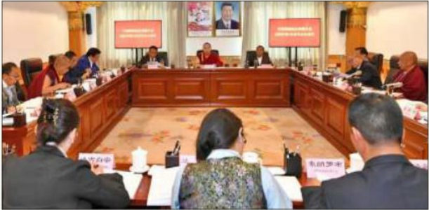
པཎ་ཚེན་རྒྱལ་མཚན་ནོར་བུས་བོད་ལྗངས་ནང་བསྟན་མཐུན་ཚོགས་ཀྱི་ཚོགས་འདུ་གཙོ་ཚོང་གྲེང་བཞིན་པ།

<<ནང་བསྟན་ཡུང་གོ་ཅན་ཏུ་བསྐྱུར་བའི་ལོ་ལྔ་ཚན་གྱི་འཆར་གཞི>>ཞེས་པ་དེ་ ལྷན་པོ་བཞེས་ཟིན་ཡུང་། བོད་རྒྱུད་ནང་བསྟན་ཡུང་གོ་ཅན་ཏུ་བསྐྱུར་བའི་ལོ་ལྔ་ ཚན་གྱི་འཆར་གཞི་ཞེས་པ་དེ་རེས་ཐོག་མ་དེ་ཡིན་སྟབས། རྒྱ་ནག་གཞུང་གིས་ བོད་ཀྱི་ཚོས་དང་རིག་གཞུང་གི་དང་། ལྷག་པར་དུ་བོད་བརྒྱུད་ནང་བསྟན་གྱི་ རིས་མེད་དགོན་སྡེ་ཁག་ལ་དོ་དམ་དང་སྟངས་འཛིན་གྱི་དཔེ་ཚང་གཞི་དེ་སྤར་ བས་དོ་ནན་དང་། འཆར་གཞི་ཡོད་པ། གོ་རིམ་ཡོད་པའི་ཐོག་ནས་ལས་དོན་ གྲེས་རྒྱ་ཡིན་པ་གསལ་པོ་ཆགས་ཡོད། ཟ࿳་མོ་ ༢༠༡༩ ལོར་གཏན་འབེབས་ གུས་པའི་ནང་བསྟན་ཡུང་གོ་ཅན་ཏུ་བསྐྱུར་བའི་ལོ་ལྔ་ཚན་གྱི་འཆར་གཞི་ཞེས་པ་ དེ་རྒྱལ་ཡོངས་རང་བཞིན་གྱི་འཆར་གཞི་ཞིག་ཡིན་པ་ལས་བོད་གཅིག་ཡུར་ དམིགས་ནས་གཏན་འབེབས་གུས་པ་ཞིག་མ་དེད། ཡིན་ནའང་། ད་མེདས་ བོད་རྒྱུད་ནང་བསྟན་ཡུང་གོ་ཅན་ཏུ་བསྐྱུར་བའི་ལོ་ལྔ་ཚན་གྱི་འཆར་གཞི་ཞེས་པ་དེ་ བོད་གཅིག་ཡུར་དམིགས་ནས་རྒྱས་བཤེད་གུས་པའི་འཆར་གཞི་ཞིག་ཡིན་ ལྟམས། དེ་སྤྲ་གཏན་འབེབས་ཟིན་པའི་རྒྱལ་ཡོངས་གཅིག་ཡུར་གྱི་འཆར་གཞི་ དང་མིན་རྒྱས་དེ་དག་གིས་མི་འགྲིགས་པར་རེས་པར་དེ་ལས་དམ་བྲག་ཆེ་བ་ དང་སྟངས་འཛིན་ཆེ་བའི་མིན་རྒྱས་ལག་ལེན་བྱ་རྒྱུའི་དོན་དུ་དེད།