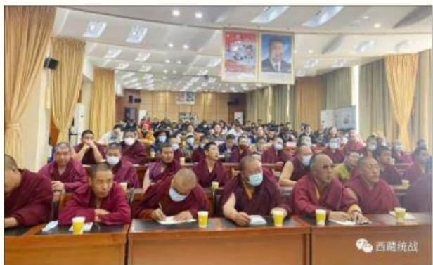
བོད་བརྒྱུད་ནང་བཟུན་གྱི་གྲུ་བཅུན་ནམས་ལ་ཆབ་ཕྱིད་སློབ་སྦྱོང་གི་ཚོགས་འདུ་འཛུགས་པ།

གཅིག་མཐུན་ཚོགས་པའི་འདུ་ཤེས་བརྟན་པོར་འཇུག་ས་དགོས་>>པའི་སྐོར་ དང་། <<ཞི་ཅིང་མིང་གིས་མི་རིགས་ལས་དོན་ཐོག་གི་གཏམ་བཤམ་>>ཟེར་ བ། <<ཞི་ཅིང་མིང་གིས་བོད་ཏུ་ལས་དོན་རྟོག་ཞིབ་ཤེད་རྒྱབ་སྐྱོར་དགོན་སྡེ་ཁག་ ལ་གནང་བའི་གཏམ་བཤམ་། >>ཟེར་བ། དེ་བཞིན་<<བོད་རང་སྐྱོད་སྡེ་རུང་ས་ མི་རིགས་མཐུན་བསྐྱེལ་ཡར་ཚོན་གྱི་དཔེ་སྟོན་ཁྲུལ་འཇུག་ས་གཏོད་ཀྱི་སྲིབ་ ཡིག>>ཟེར་བ། <<ལྷ་ས་ཕྱོང་ཁེར་མི་རིགས་མཐུན་བསྐྱེལ་ཡར་ཚོན་གྱི་སྲིབ་ ཡིག>>ཟེར་བ་སོགས་ལ་སློབ་སྦྱོང་ཤེད་ཏུ་བརྟུག་ཡོད།