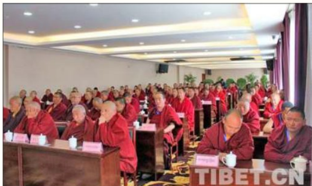
ཆབ་མདོ་ཁྲིམ་ཏུ་པོད་བརྒྱུད་ནང་བསྟན་གྱི་དགོན་སྡེ་ལས་སྡེ་གསེས་སྤྱོད་གི་འཛིན་བྲལ་གཉེར་བའི་ཚོགས་འདུ།

༧། 38 ཕྱི་ལོ་ ༢༠༡༤ ཟླ་ ༥ ཚེས་ ༡༥ ཉིན་ཆབ་མདོ་ཁྲོད་ཁྲིམ་ཏུ་བཀའ་བཞུགས་པོད་བརྒྱུད་ནང་བསྟན་གྱི་དགོན་སྡེ་ལས་སྡེ་གསེས་སྤྱོད་གི་འཛིན་བྲལ་གཉེར་བའི་ཚོགས་ཚུགས་མངོན་སྟོན་ཚུགས། དེ་ནི་མེད་ས་ ༣༦ བ་དེ་ཚགས་ཡོད་པ་དང་དེས་མེད་དགོན་སྡེ་ཁག་ནས་བྱ་བ་ཚུན་ ༡༥༥ མཉམ་ཞུགས་བྱེད་ཏུ་བཅུག་ཡོད། ཏུས་ལུན་དེའི་སྤོང་ <<ཞི་ཅིང་མིང་གི་ཏུས་སྐབས་གསར་བའི་ཡུང་གོའི་ཁྱད་ཚེས་ལྡན་པའི་སྤྱི་ཚོགས་སྤོང་ལུགས་གྱི་དགོངས་པ་>>མེད་བ་དང་། <<ཞི་ཅིང་མིང་གི་ཚེས་ལུགས་ལས་དོན་སྟོར་གྱི་གསུང་ཚེས་>> མེད་བ། <<ཞི་ཅིང་མིང་གི་སྤྱི་ཁམས་ཤེས་དབལ་གྱི་དགོངས་པ་>> མེད་བ། <<ཡུང་ཏུ་མི་སྡེ་གསལ་གཅིག་མཐུན་གྱི་འདུ་ཤེས་ཟབ་ཏུ་གཏོང་བ།>>མེད་བ། <<པོད་བརྒྱུད་ནང་བསྟན་གྱུར་གོ་ཅན་ཏུ་སྐྱོགས་པ་>>མེད་བ་བཅས་སྟོན་ཁྲིད་བྱས་ཡོད།